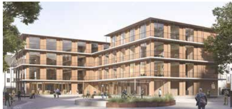
Ende des Jahres beginnen die Bauarbeiten für das neue KundenZentrum der Sparkasse in Achern. (Quelle Projektbild: Harter + Kanzler & Partner, Freie Architekten BDA – PartG mbB)

Mit der Fertigstellung des Neubaus bis Ende 2025 folgt der Umzug zurück an den bisherigen Standort. Mit Holz als wesentlichem Material entsteht