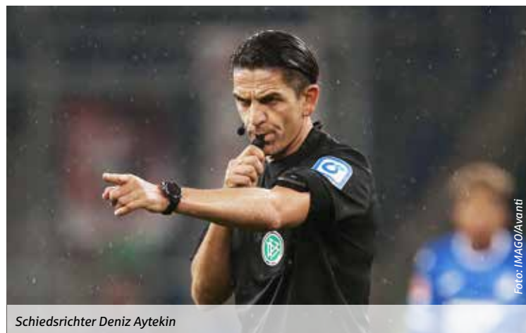
Schiedsrichter Deniz Aytekin

Verkauf: sparkasse-offenburg.de/saugutlive oder Tel. 0781 200-1515 (Mo–Fr 8–20 Uhr)